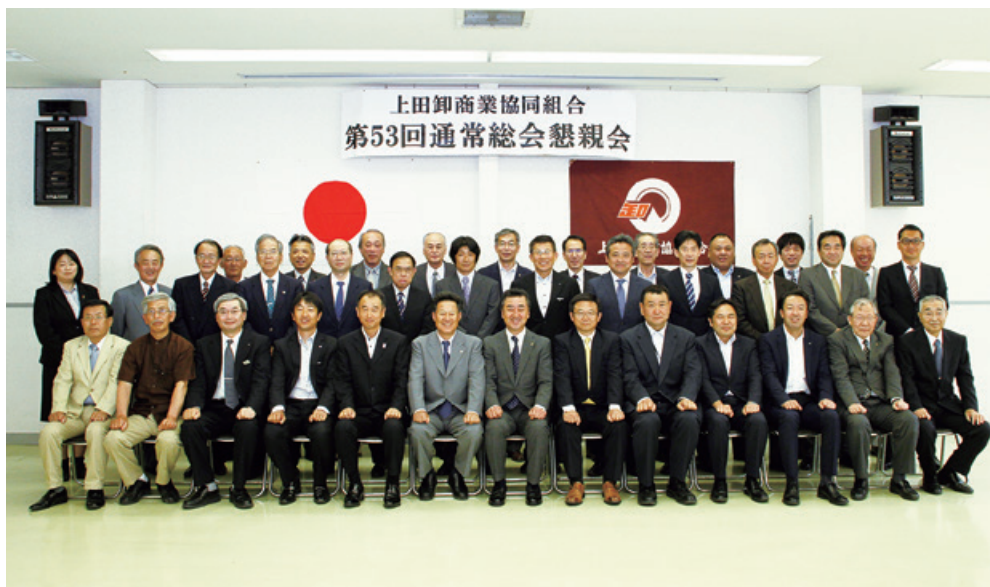
上田卸商業協同組合 第53回通常総会懇親会 記念撮影

い、賛助会員を交えて懇親会を行いました。 懇親会へは各社2名のご参加をお願いし、48名の参加を頂き盛大な懇親会となりました。 当日のご来賓は、上小地方事務所商工観光課、上田市商工観光部、上田商工会議所、商工中金長野支店、八十二銀行上田支店、中小企業団体中央会、上田信用金庫本店、秋和自治会、榊網土地改良区、小宮山税理士事務所の方々でした。