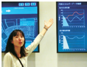
スマートタウン事務所にて発電状況の説明を受ける