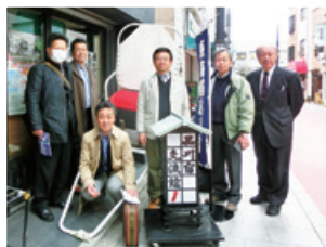
品川宿交流館にて