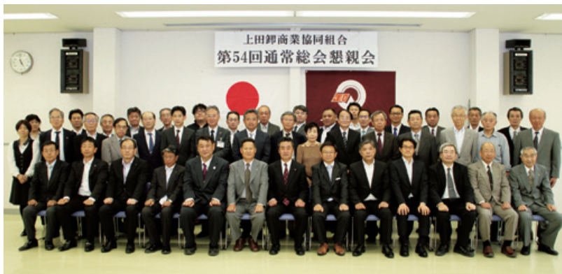
上田卸商業協同組合 第54回通常総会懇親会 記念撮影

ご来賓の方々及び出席組合員と、賛助会員を加えて記念撮影を行なった後、懇親会を開催しました。