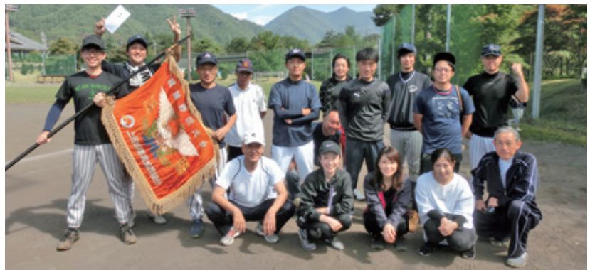
三連覇を果たした新村チーム