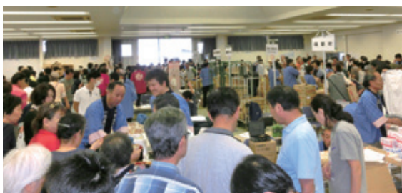
開場直後の賑わい。ことしは、ホール内会場の動線も改善され、スムーズにお買い物を楽しんでいただきました。

来場者数は、10時の開場前には、あいにくの空模様にも拘わらず、既に300人近くを数え、当初の不安も一瞬で払拭することができました。