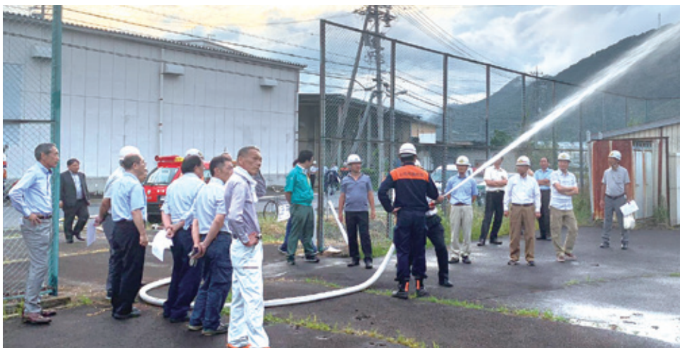
参加者が上田冷蔵(株)横の消火栓から運動場まで、3本のホースを繋ぎ、運動場で放水する実践的な訓練を行いました。

昨年は、雨天のため開催を見合わせた初期消火訓練。ことしは、秋和自治会の役員の方々も含め、38名が参加。(株)北信ポンプ様、上田市消防団第8分団のご協力のもと、8月30日に実施されました。ことしは、新たに消火ホースのつなぎ方から放水迄と、より実践的な訓練内容となりました。