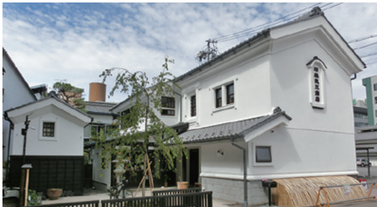
石森良三商店店舗

蔵は江戸時代後期に建築されたもので、今回の開店のために大工、左官の手により、約1年をかけて改築・再生されました。石森(株)は冠婚葬祭の贈答品の卸商ですが、近年は信州の逸品を集めたカタログギフトの企画・販売にも注力してきています。1階は、地元・県内の