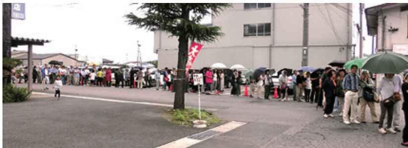
小雨の中、開場を待つ300人近くの来場者の皆さん。

今回は、昨年節目の第10回開催の後という、言わば「踊り場」的な位置づけの年でもありました。開催前は、来客数の減少等を不安視する声もありましたが、蓋を開けてみますと1200人を超すお客様にご来場をいただきました。これも、事前に新規出店者等、各方面に声をかけたことが奏効したものと考え、今後の「市」のあり方を模索するうえで、参考とすべき事項が色々確認できた内容の開催でありました。