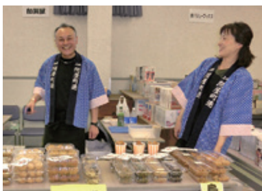
新規出店者も開場準備完了。

お声を取り入れ、より一層、内容の充実したイベントにしてまいります。 ※出店者数 24社