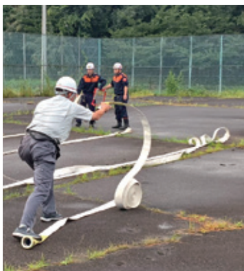
消火ホースの延ばし方。ボウリングの様に投げると、真っ直ぐ延ばせるようです。