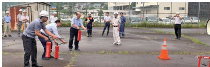
消火器による初期消火訓練。1.安全ピンを上引き抜く。2.ホースの先端を消火器から外し火元に向ける。 3.レバーを握る。