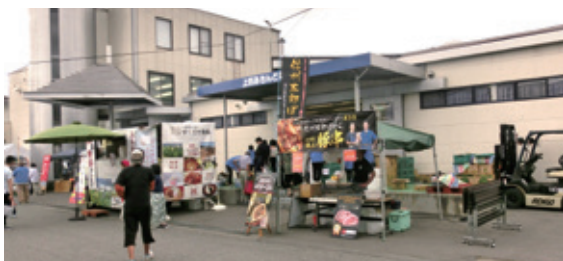
ホール前の飲食関係ブース。売切れ・完売もありました。

りましては、事業内容の変化もあり、組合員企業出店者数の拡大が難しい局面に差し掛かっていることも懸念材料ではありますが、これまでの経験と反省、そして、皆様方の