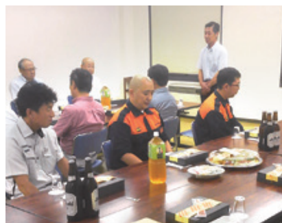
冒頭、桑原理事長より挨拶