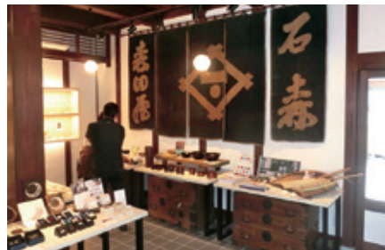
店舗内1階・様々な手仕事商品を陳列。