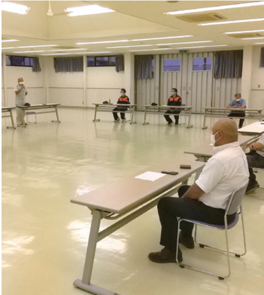
密を避けて大ホールにて