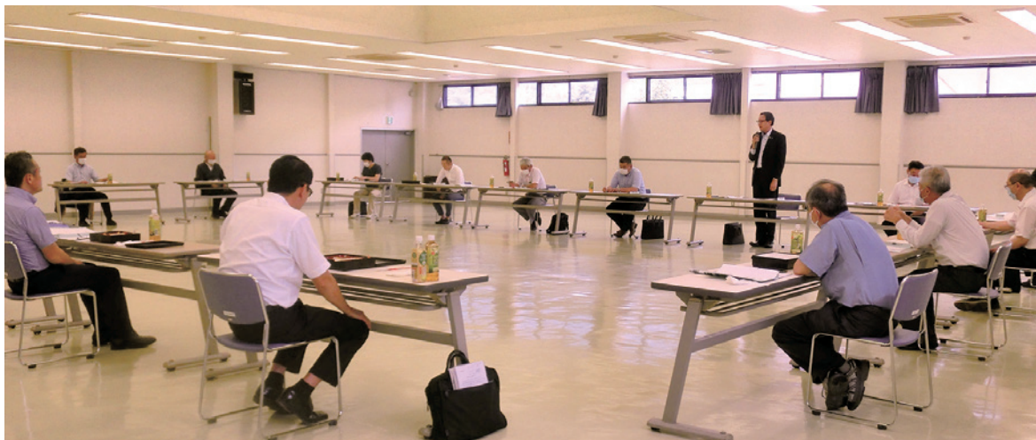
第1回委員会・大ホールにて

編集・発行 上田卸商業協同組合 〒386-0041 長野県上田市問屋町510-2 TEL 0268-22-6649 (代) FAX 0268-22-6714 URL : http://www.ueda-oroshi.or.jp/ E-mail : info@ueda-oroshi.or.jp